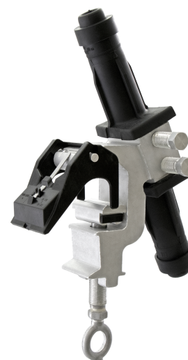
CD74 AG06 G

Modèle G : cas d'une utilisation avec un câble Almélec gainé. Chaque extrémité du dérivé est munie d'un joint d'étanchéité ainsi que d'un bouchon amovible comportant un indicateur de présence et de bon positionnement du conducteur dans la cage dérivée, et qui SECURITE ACCRUE se rétracte si le conducteur est mal positionné.